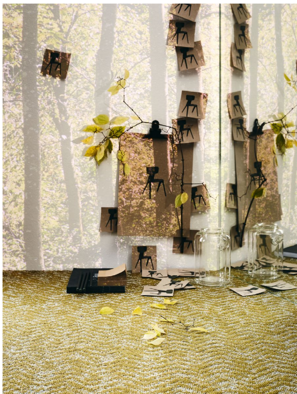
DUO DUNE, Farbe 718 Wild Safari