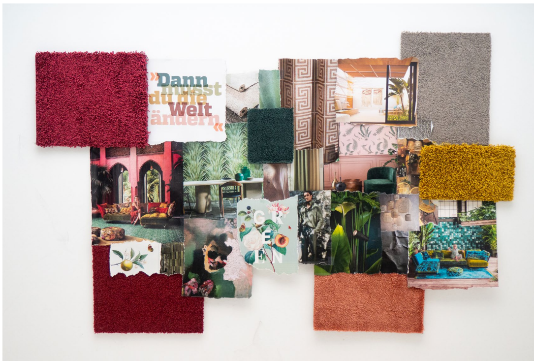
DUO – erste verfügbare Produkte: SMOOZY, SILKY SEAL, MADRA (von links nach rechts)