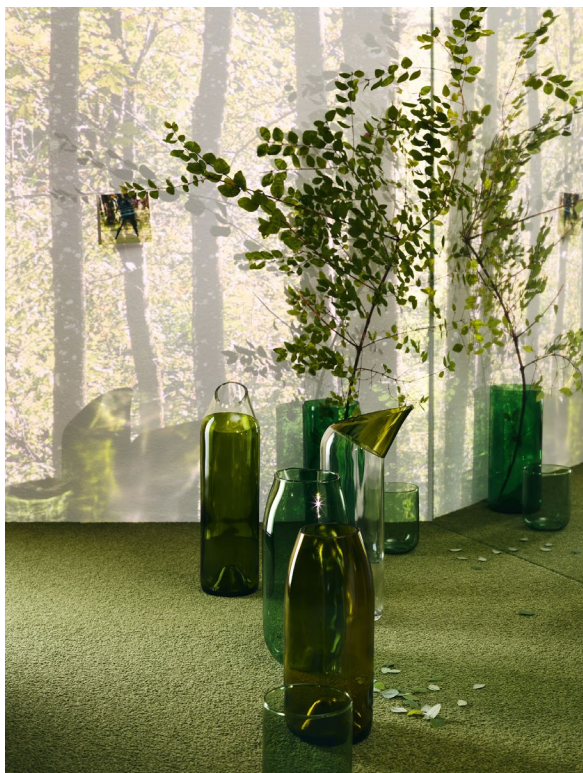
DUO MADRA, Farbe 1135 Matcha